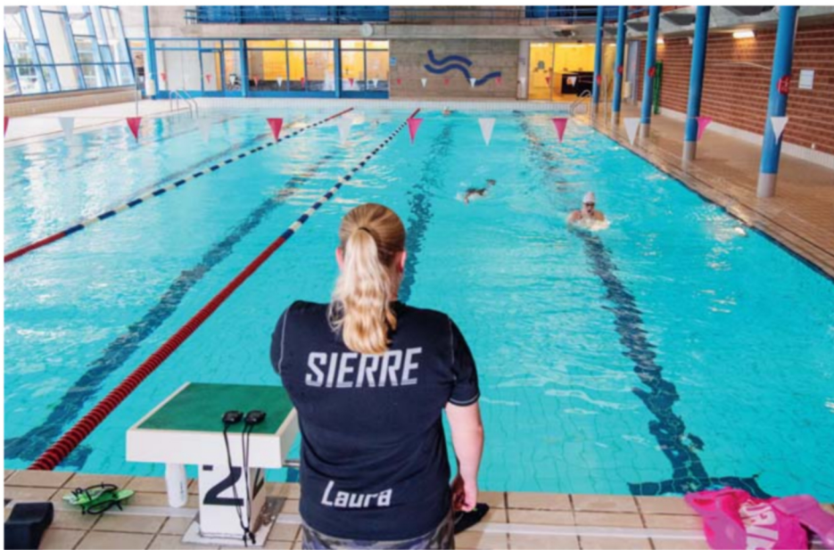
Le Club de natation de Sierre compte plus de 200 membres. Il a pris un nouveau départ en 2019.